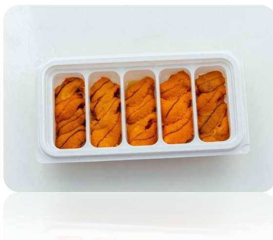
Carne de erizo de mar (100 g)